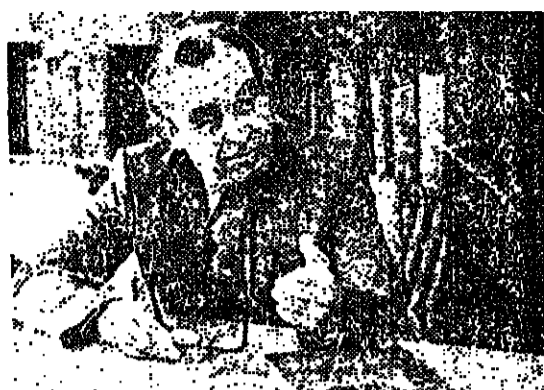
يوري كورولوف مدير معهد التاريخ التابع لأكاديمية العلوم الأوكرانية يتحدث عن معركة الدنيبر التي كانت من أكبر معارك الحرب العالمية الثانية، والتي يحتفل السوفيت بالذكرى الأربعين لها.